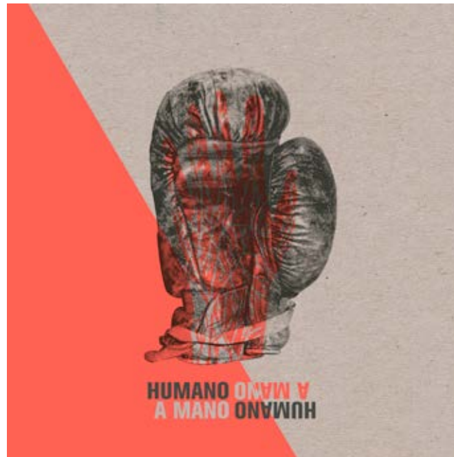
Humano a Mano - 2016